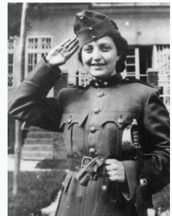
חנה סנש

חנה סנש - צעירה אידיאליסטית שיצאה בשליחות היישוב לאירופה הכבושה, להציל את עמה, להציל את אימה. מה מביא בחורה מוכשרת, כותבת מחוננת, לעזוב את ביתה ואת משפחתה, להפנות גב לנוחות ולעלות למקום לא מוכר, לקיבוץ בתחילת דרכו? מה מביא בחורה צעירה לצנוח בשלהי המלחמה ללב התופת, אירופה הכבושה, ולפלוס דרך לארץ הולדתה - הונגריה? שנים מעטות לפני שליחותה כתבה "למות צעירה לא רציתי". מה קרה במעבר הגבול וכיצד עמדה מול חוקריה ומענייה? מה בחרה חנה לכתוב במכתב האחרון לפני מותה, וכיצד בחרה למות?